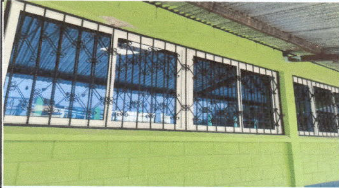
Foto1 Sustitución de ventanas de madera por metal más vidrio