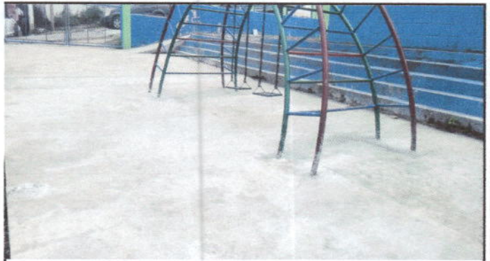
Foto 4: Reparación de planchas de concreto de patio. Area B de la escuela