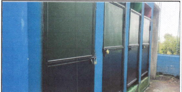
Foto 6: Así quedó el segundo patio, ya finalizados los trabajos de mejoramiento.

Observación: Si es necesario se pueden agregar hojas adicionales y actualizar el número de hojas.