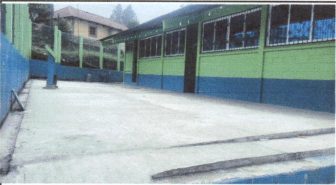
Foto 3: Reparación de planchas de concreto de patio. Area A de la escuela